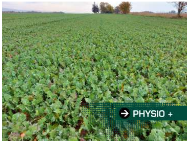
→ PHYSIO +